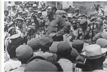
Den store ledaren.

■ Fjorton av krigsfångarna ställdes inför rätta. Fem av dem avrättades då de gjort sig skyldiga till mord under Batistadiktaturen och nio dömdes till 30 års fängelse. Förhandlingarna om utväxling av de resterande slutade med att Washington gick med på att sända mediciner och livsmedel till ett värde av 53 miljoner dollar till Kuba.