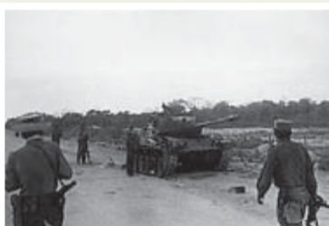
Vid invasionen.

■ Att ett anfall skulle komma var väntat av bröderna Castro. Det fanns tillförlitliga rapporter från den kubanska säkerhetstjänsten om att en invasionsstyrka med exilkubaner byggts upp med hjälp av CIA. Den 1 april 1961 fick säkerhetspolisen därför order om att fängsla alla misstänkta kontrarevolutionärer i landet.