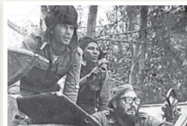
Fidel Castro den 17 april 1961.

■ Den 15 april gick stridsflygplan till anfall mot flygbaserna i Havanna och Santiago. CIA hade gett planen en felaktig märkning som gjorde att det gick att bevisa att USA låg bakom.