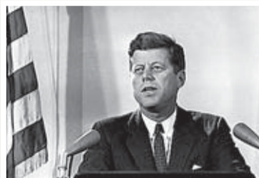
President John F. Kennedy.