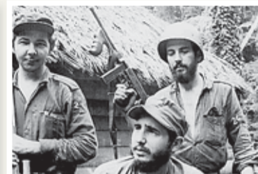
Raúl (tv) och Fidel Castro.

■ Tidigt i gryningen den 17 april 1961 landsattes en invasionsstyrka på 1 350 man vid Grisbukten, ett obefolkat träskområde på Kubas södra kust. USA:s nytilträdde president John F. Kennedy var ytterst ansvarig för invasionen men planen hade han arvt från sin föregångare. Kennedy gav order om att inga amerikanska soldater fick landstiga.