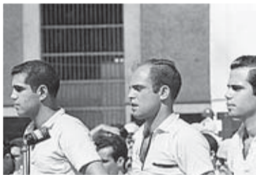
Under rättegången.

■ Klockan kvart över ett på morgonen måndagen den 17 april 1961 inleddes invasionen. Två dagar senare kapitulerade angräparna. Totalt togs 1 189 män till fånga.