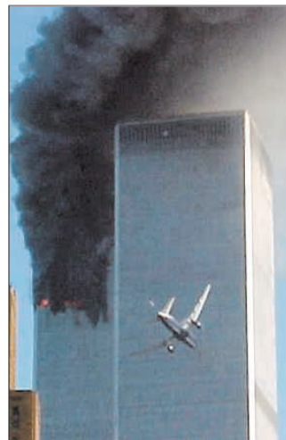
Terrorattacken mot World trade center den 11 september.

och använt telefonkortet från butiken, säger mannen.