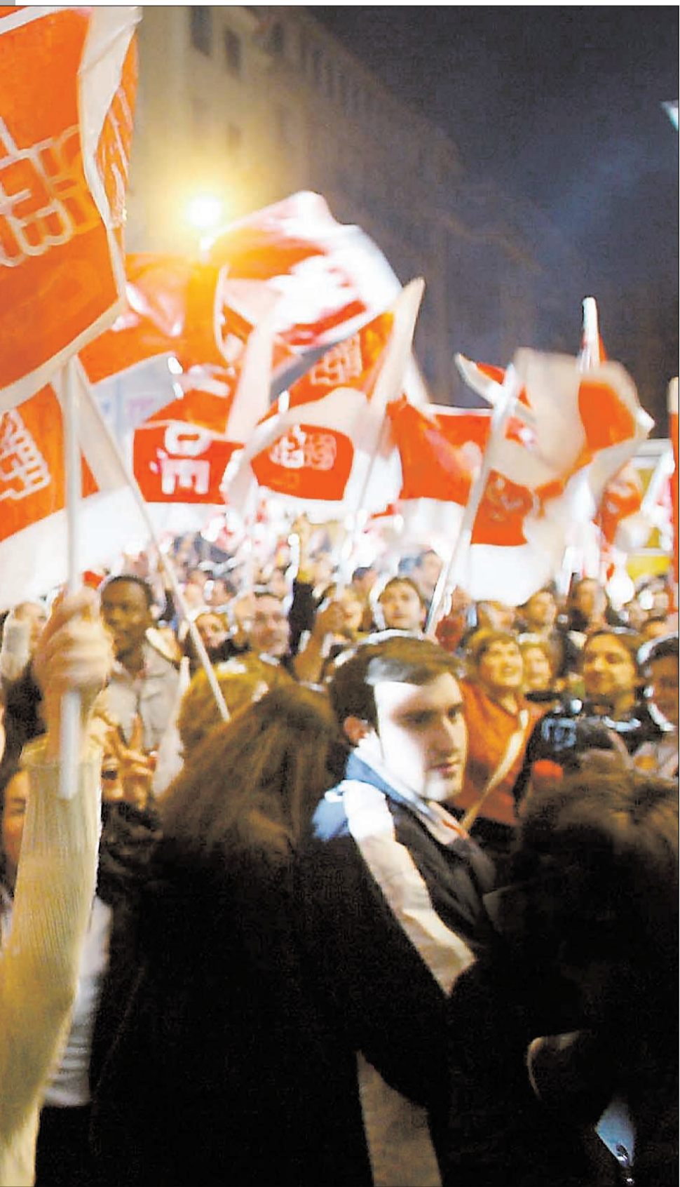
Tidigt i morse körde tutande bilar runt i Madrid med flaggor genom fönstret.