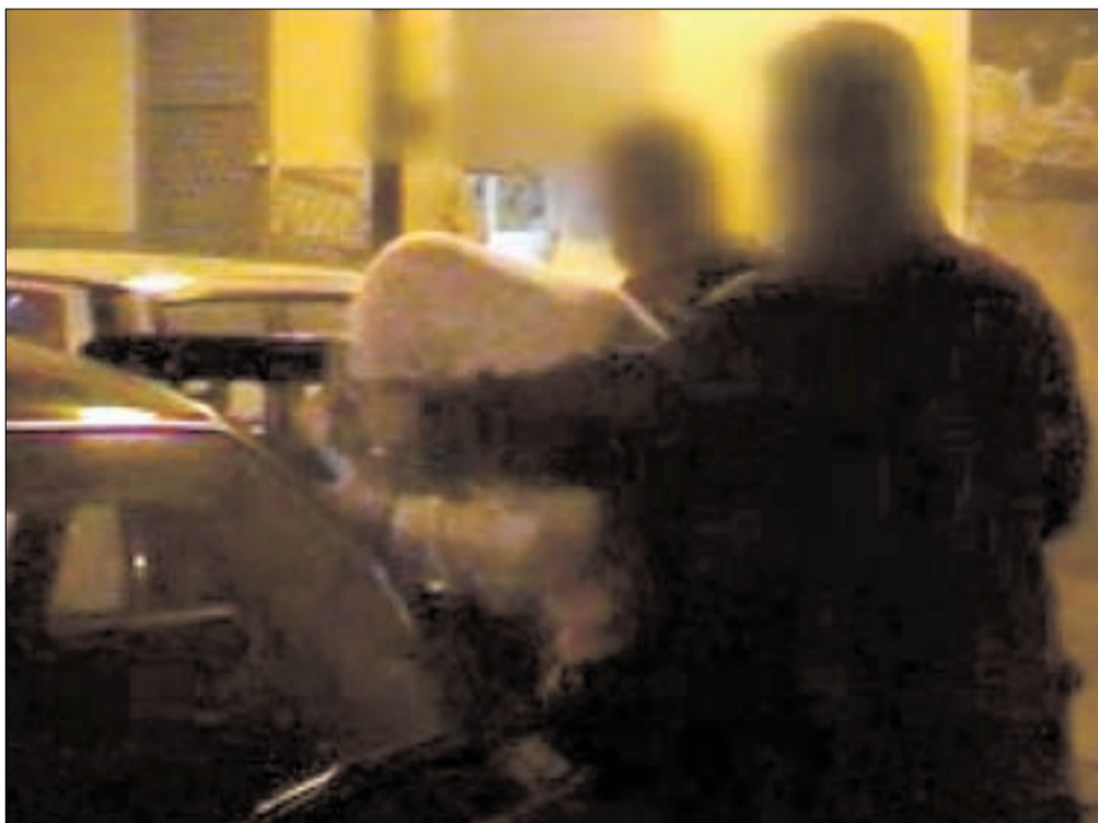
HÄR GRIPS HAN En av de gripna männen har tidigare pekats ut som inblandad i förberedelserna för terrorattackerna den 11 september 2001.