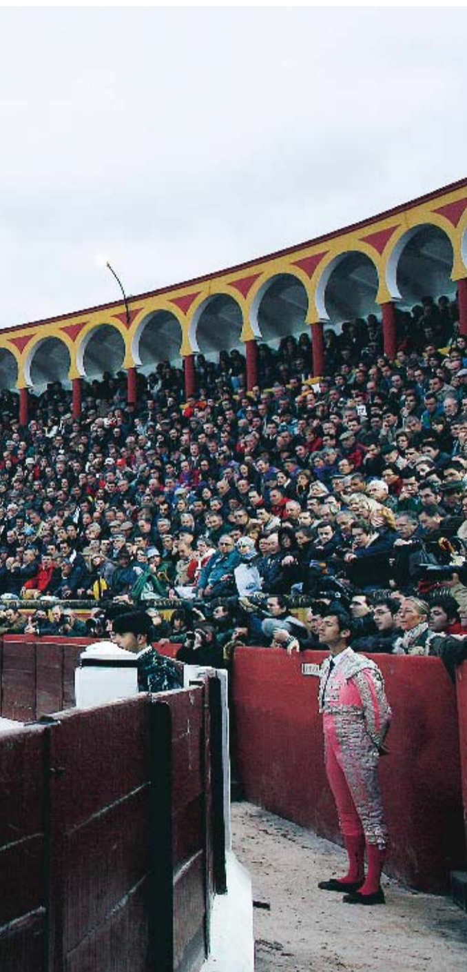
under ett år.