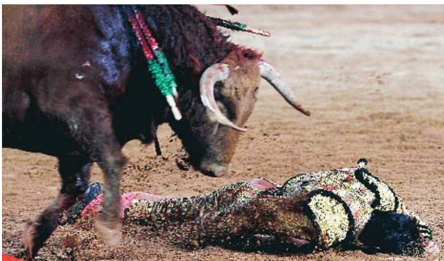
Den spanske tjurfäktingaren Miguel Angel Perera attackerades av en tjur under en tjurfäkting i Olivenza.